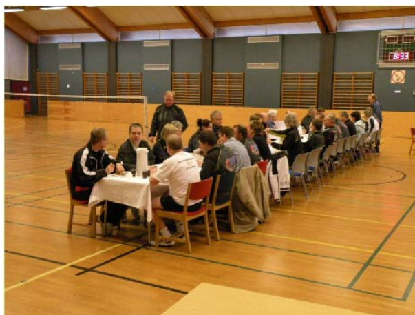
Fællesspisning i hallen

Der var lækkert morgen- og frokostbord i hallen om lørdagen.