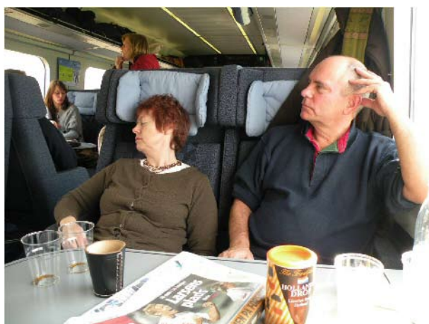
Flere spillere på vej hjem i toget mod København