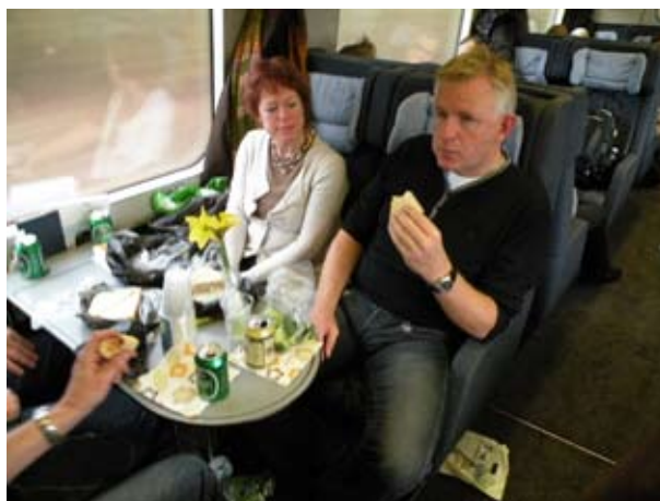
På vej hjem.

SIF mesterskabet blev i år afviklet i Frederikshavn. Det er en hyggelig men også meget lang tur i tog derop, men det føles endnu længere på vej hjem