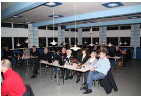
En del af fremmødet

Formanden takkede dirigenten for god ro og orden og erklærede generalforsamlingen for slut.