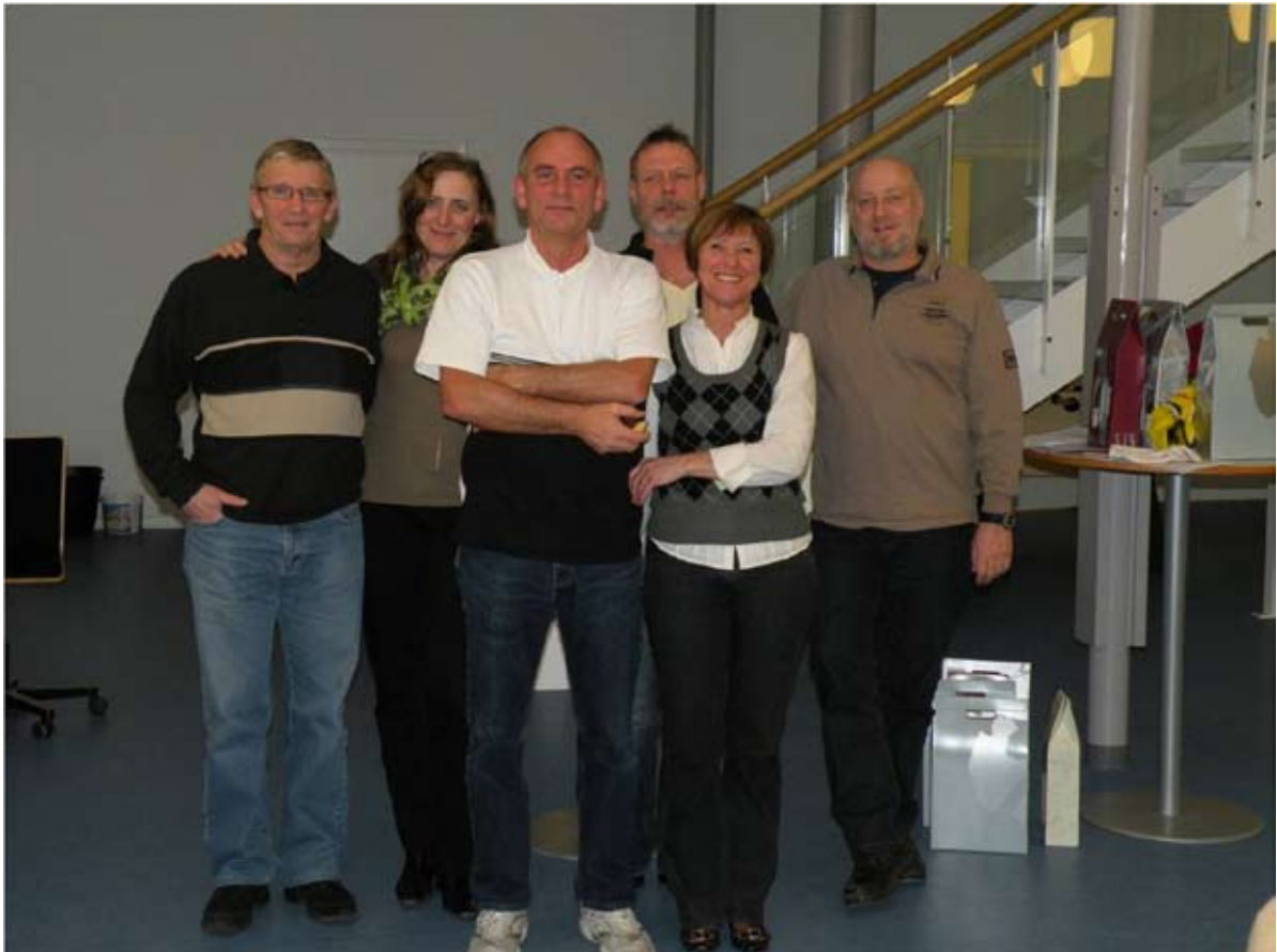
Et lille udvalg af vindere